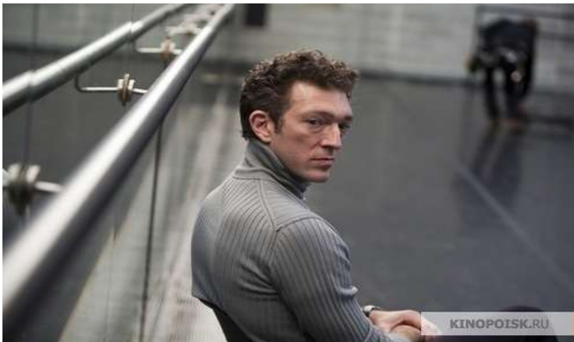
Рисунок 2 Тома Лерой

Тома Лерой (Венсан Кассель)– балетмейстер труппы, он занимается постановкой новой версии лебединого озера. Имеет дурную репутацию, считается, что он пользуется своим положением по отношению к балеринам.