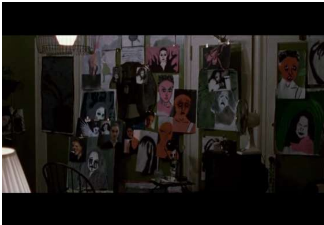
Рис. 6 Картины матери Нины

развитии, она не позволяет ей быть свободной, и, что самое главное, мать перестает быть авторитетом. Нина видит галлюцинацию, в которой картины матери движутся, и кричат «Моя очередь!», это предвестники окончательного разрыва, и укоренившейся идеи, что мать живет жизнью Нины, а не своей.