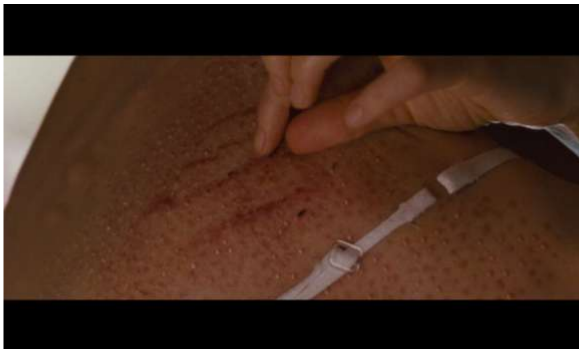
Рисунок 10 Нина извлекает из-под кожи перо

Далее сыпь Нины, из которой она извлекает перо, говорит о её превращении в черную лебедь (рисунок 10).