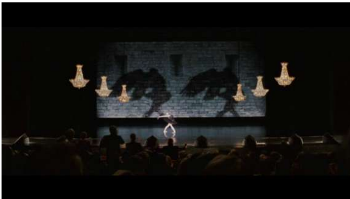
Рисунок 13 Тень Нины

Примечательно, что когда нам показывают кадр из зала, Нина предстает в своем обычном облике, однако у её тени мы видим крылья (рис. 12).