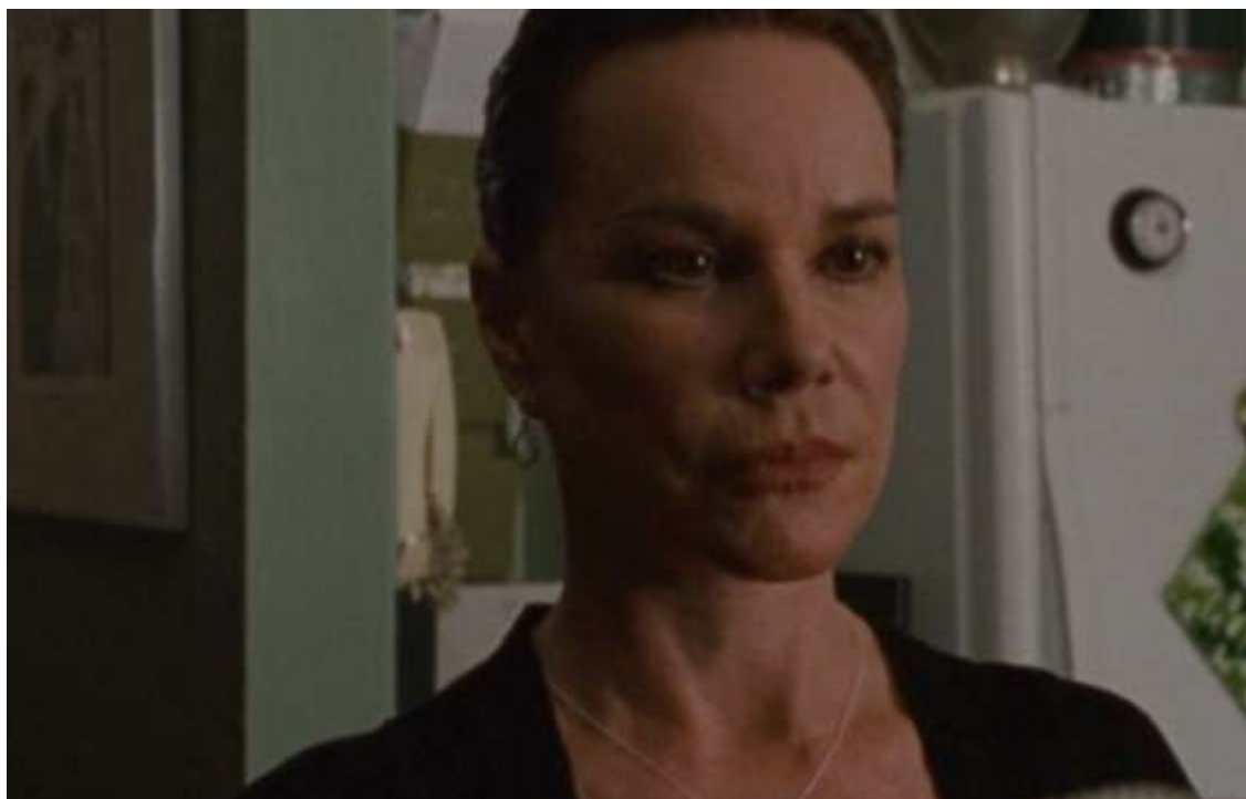
Рисунок 3 Мать Нины

Мать Нины (Барбара Херши) – бывшая балерина, бросившая карьеру ради воспитания дочери, помешана на балете и карьере Нины, во всем её контролирует.