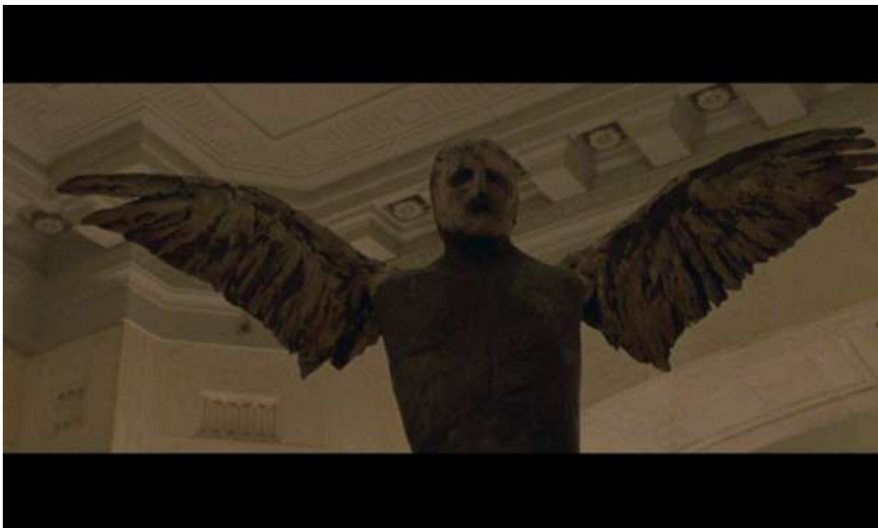
Рисунок 9 Статуя мужчины с крыльями

проводит параллель между Бэт и лебедью, которой она теперь перестала быть.