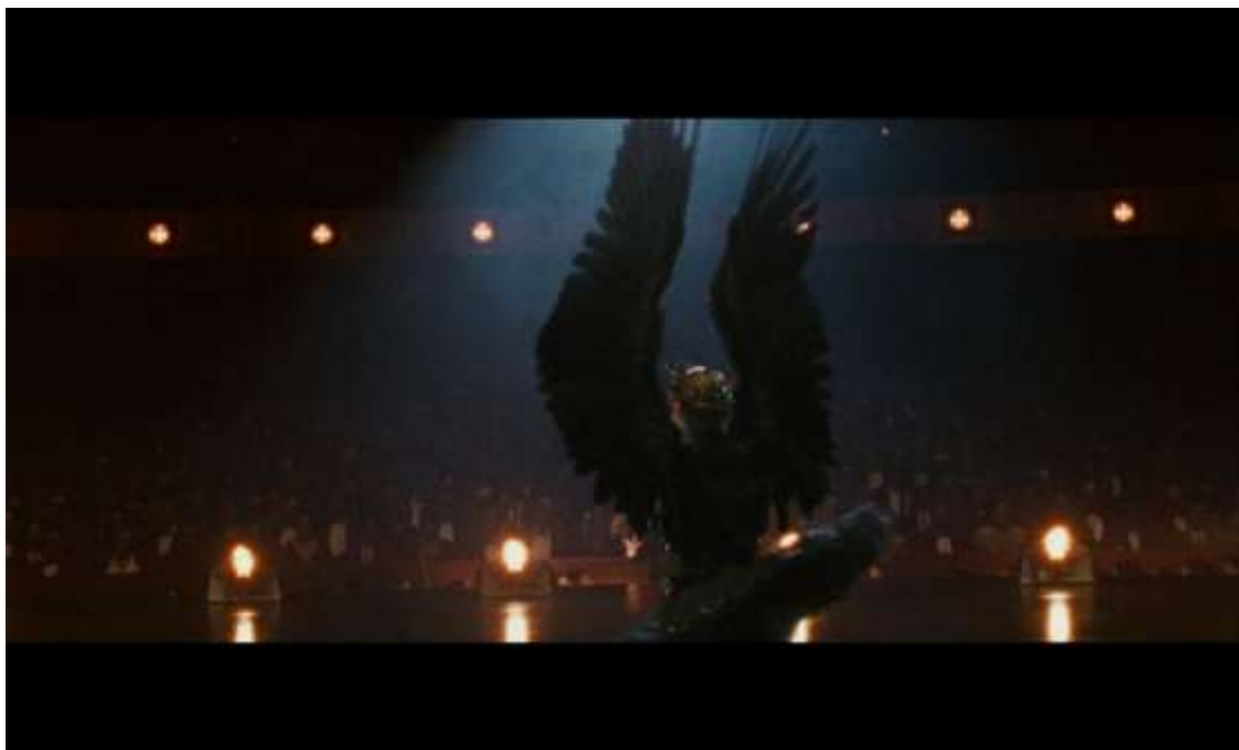
Рисунок 11 Танец черной лебеди

Вообще сыпь Нины становится все больше и больше, по мере развития её психоза, пока в конце она не покрывается перьями (рисунок 11).